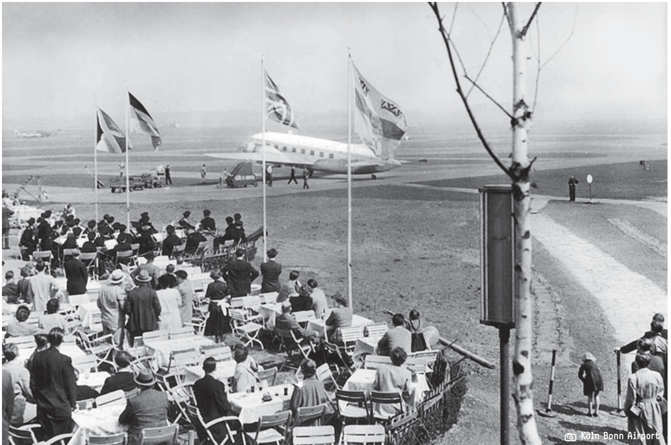
Der „Flower-Airport“, so wurde der Flughafen Köln/Bonn in den Anfangsjahren genannt, war ein beliebtes Ausflugsziel.

dringend notwendig. Als geeigneter Ort für einen Flughafen in Regierungsnähe kommt 1949 der ehemalige Luftwaffen-Fliegerhorst Wahn ins Gespräch, der nach Kriegsende von der Royal Air Force genutzt wird. Der britische Hochkommissar Sir Brian Robertson gibt zu verstehen, dass auf dem großen Areal in Porz-Wahn durchaus auch ziviler Luftverkehr Platz finden könne.