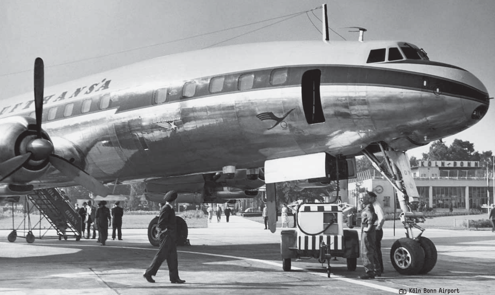
Köln Bonn Airport

Die Geschichte der Luftfahrt in Köln beginnt 1906, als in Bickendorf der Kölner „Club für Luftschiffahrt“ einen Landeplatz für Zeppeline eröffnet. Bis mit dem „LZ 3“ aus Friedrichshafen das erste starre Luftschiff in Köln Station macht, vergehen aber noch drei Jahre.